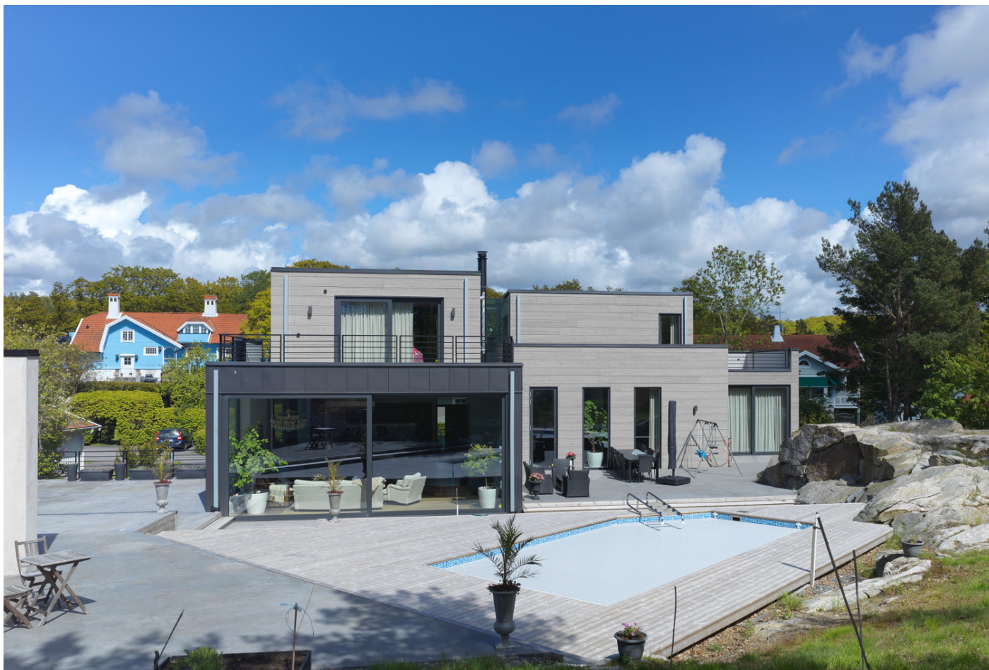
En av marknadens största lyftskjuddörr, Sapa 2160, med mått 7500 x 3500 mm (!) öppnar upp mot baksidan